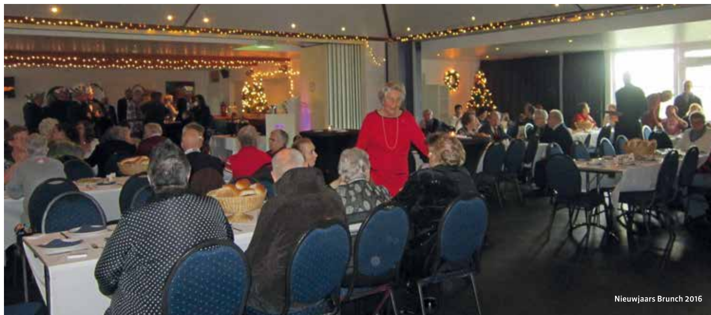
Nieuwjaars Brunch 2016

We starten om 13.00 uur en gaan gezellig door tot een uur of vijf. We hopen ook u te mogen begroeten.